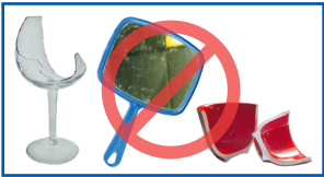
Suxuunta dhalooyinka ah, muraayadaha daaqadaha, iyo dhoobka