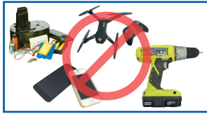
Elektroniga iyo baytariyada