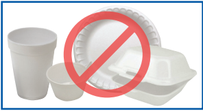
Fuumka caaga ah (Styrofoam™)