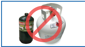
Dhululubada la cadaadiyo (propane, helium, CO2)