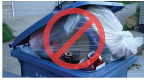
Dib u warshadaynta baagaga