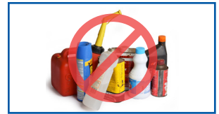
Weelasha ay ku jiraan alaabada halista ah

U hel xulashooyinka qashin-qubka ee alaabtan iyo qaar kaloo badan oo ku saabsan Hagaha Qashin-saarida Cagaaran hennepin.us/green-disposal-guide