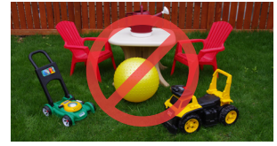
Alaabaha waaweyn ee caaga ah iyo alaabta lagu ciyaaro