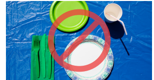
Saxamada waraaqaha ka samaysan, koobab, istiraashooyin, dhuumaha, iy maacuunta