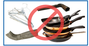
Walxaha birta ah ee aan kala sooca lahayn