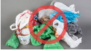
Bacaha balaastikada ah iyo filimka baagaga

Waxyaabaha soo socdaa waxay dhibaato ku keenaan habka dib-u-warshadaynta sababtoo ah waxay isku qasmaan qalabka, waxay dhaawici karaan shaqaalaha, mana haystaan suuqyo dhammaad wanaagsan oo ay ka dhigaan qalab cusub. Ka saar dib u warshadayntaada. Wax badan ka ogoow hennepin.us/recycling