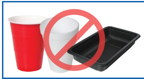
#6 iyo baco madow